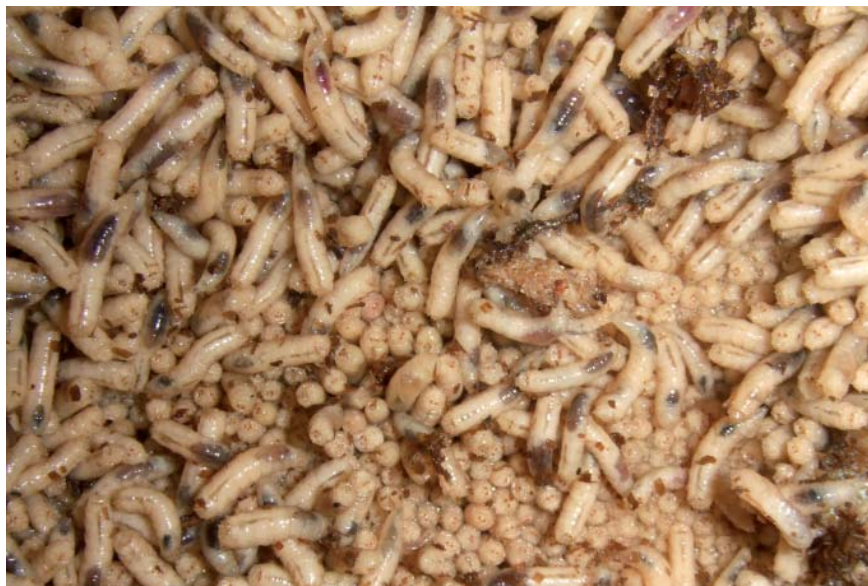
Vue d'une masse larvaire de Lucilie soyeuse - Cliché ??

La présence de restes d'insectes permet aussi d'identifier l'origine de drogues importées. Dans une enquête sur une affaire de drogue, les méthodes chimiques n'ont pas permis de préciser la provenance d'un lot de cannabis alors que la