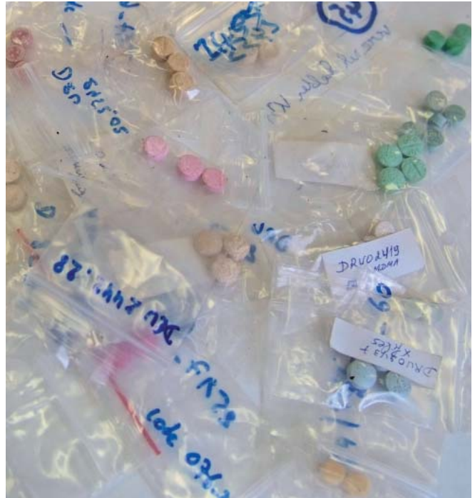
Exemples de différentes formes de pilules XTC (extasy et dérivés d'amphétamines)

L'entomotxicologie étudie les substances toxiques que peuvent contenir des tissus entomologiques. Appliquée aux insectes nécrophages, elle permet de détecter la présence de substances contenues dans les cadavres dont ils se sont nourris. À ce titre, elle s'est surtout développée comme une nouvelle branche de l'entomologie légale 1 .