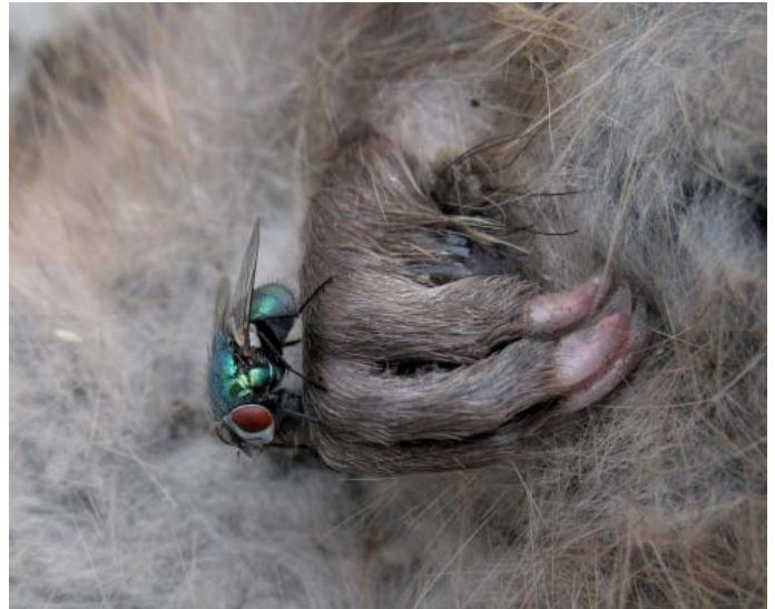
Mouches bleues ( Calliphora sp.) et mouche verte ( Lucilia sp.) sur cadavre de rat musqué

à partir d'insectes est relativement aisée et efficace (absence d'émulsion). Les insectes nécrophages, mais aussi tout le cortège de leurs prédateurs et parasites, sont présents pendant un large intervalle de temps (surtout lors de stades avancés de décomposition). Les insectes sont aussi généralement très abondants et leurs restes sont très résistants aux conditions climatiques 2 .