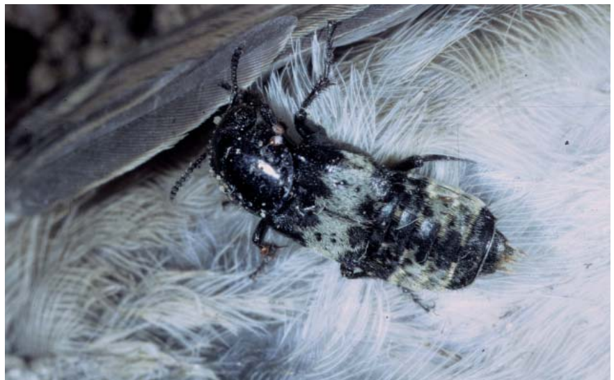
Creophilus maxillosus , un Coléoptère nécrophage (Staphylinidé)

Pour les dosages de drogues, les insectes offrent de nombreux avantages par rapport au sang ou à l'urine. Lors de la décomposition du cadavre, ces fluides ainsi que les organes se dégradent rapidement, ce qui rend les dosages classiques impossibles. L'extraction de drogues