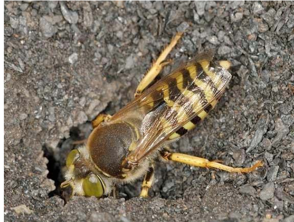
Figure 1. Femelle de Bembix rostrata à l'entrée de son nid. Terril d'Hensies (B), 23.VI.2005

En Wallonie, la carte de Leclercq (1978) montre seulement deux points. Le premier à Anseremme (prov. Namur) en 1945 et le second à Torgny (prov. Luxembourg) après 1950 (Banque de données fauniques de Gembloux et Mons).