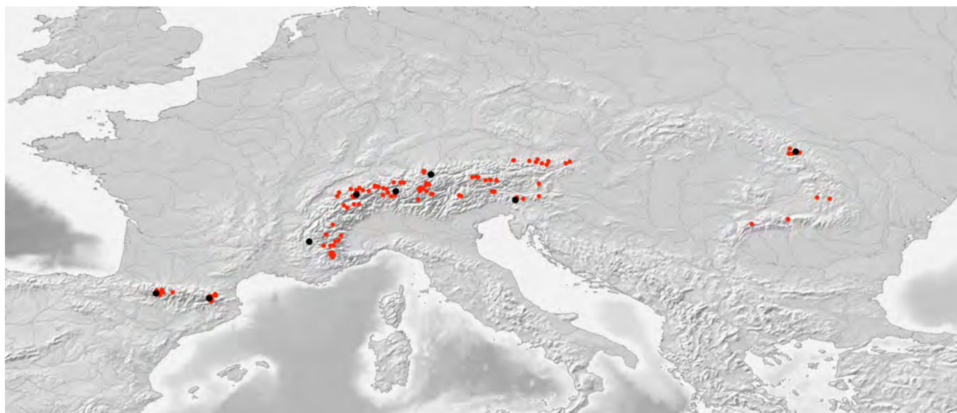
Figure 2. Carte de distribution de Bombus gerstaeckeri MORAWITZ 1881. Les données proviennent de la BDFGM (Banque de Données Fauniques de Gembloux et Mons, points rouges) et ont été complétées par les observations réalisées lors des étés 2010 et 2011 (points noirs).

Ces sites sont repris sur la carte de distribution actualisée réalisée en grande partie à l'aide des observations rassemblées dans le cadre du projet STEP (Status and Trends of European Pollinators, http://www.step-project.net ) et répertoriées dans la BDFGM (Banque de Données Fauniques de Gembloux et Mons) (Figure 2). Etant donné la rareté de cette espèce, nous avons essayé d'éviter au maximum de nuire aux populations par l'échantillonnage. Ainsi, une grande partie de l'étude génétique se fera sur base d'extractions d'ADN réalisées à partir d'une patte prélevée sur des