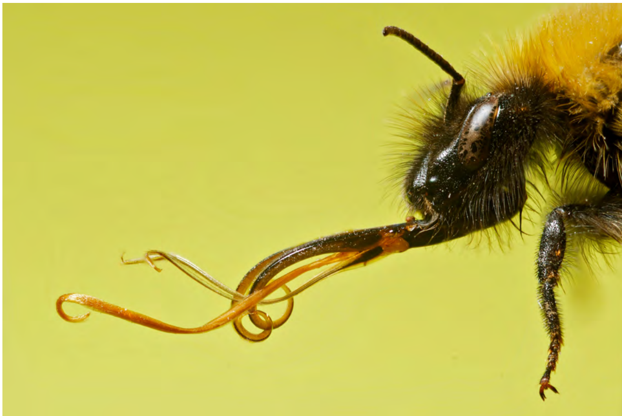
Figure 3. Détail du long proboscis et de la tête allongée de Bombus gerstaeckeri MORAWITZ 1881, typique du sous-genre Megabombus.

individus de collection. Pour les populations dont nous ne possédions pas ou peu d'individus de collection, nous n'avons échantillonné quedes ouvrières ou des mâles en fin de phénologie (p.ex. encore pour les deux populations échantillonnées en Suisse. Sur les différents sites, nous n'avons jamais observé de visites de B. gerstaeckeri sur des plantes autres que des aconits.