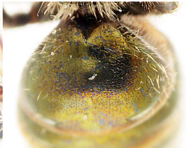
d - base déclive du premier tergite