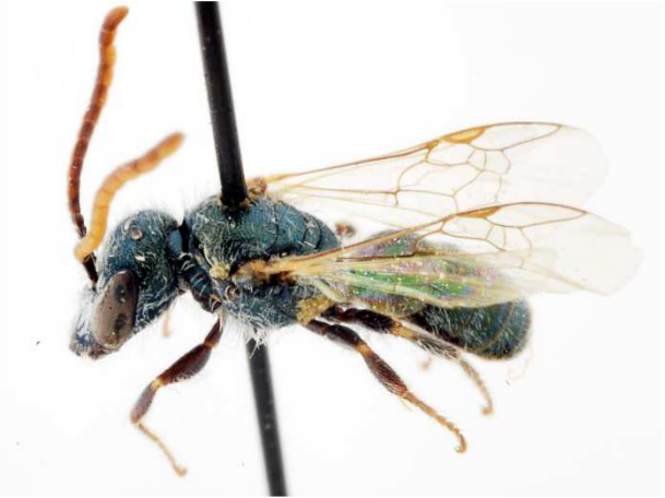
b - mâle