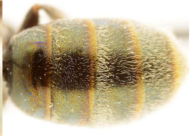
f - metasoma