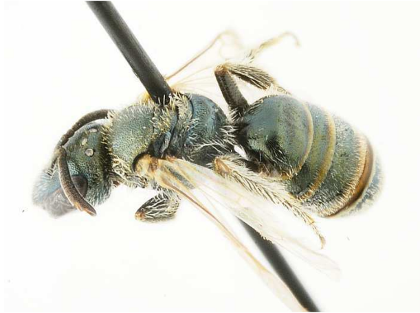
a - femelle