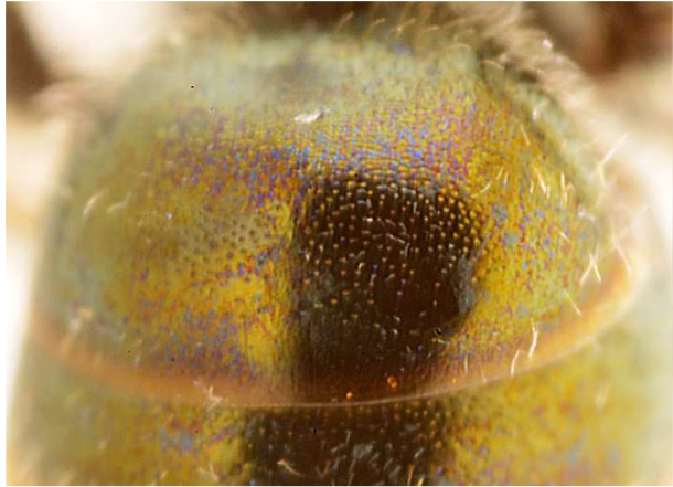
e - premier tergite