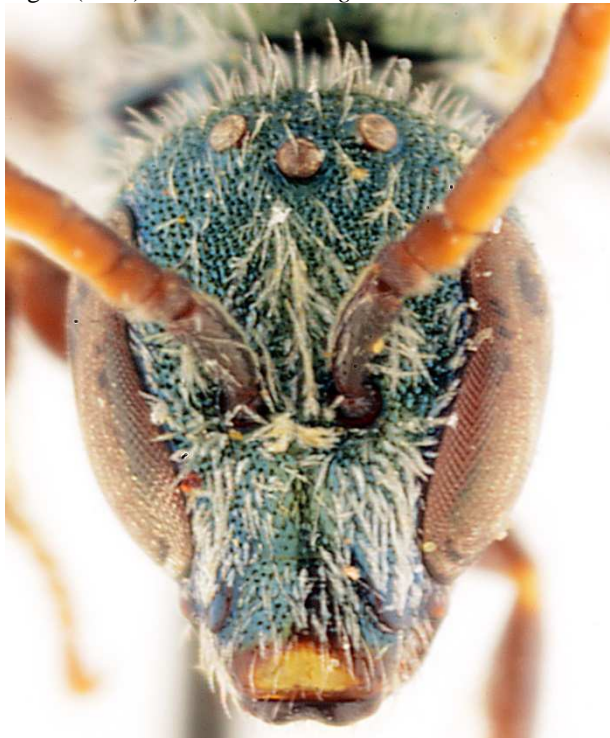
a - tête