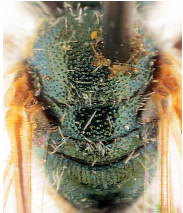
b - mesosoma