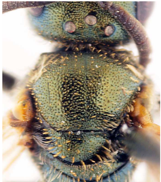
b - mesosoma