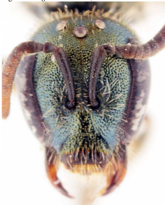
a - tête