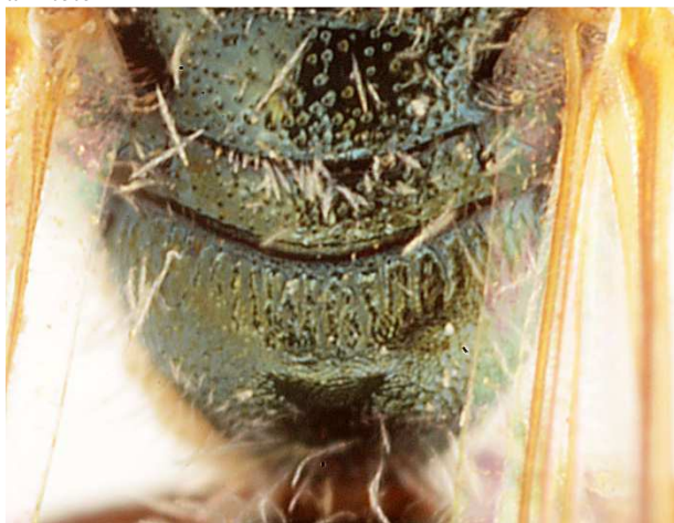
c - propodeum