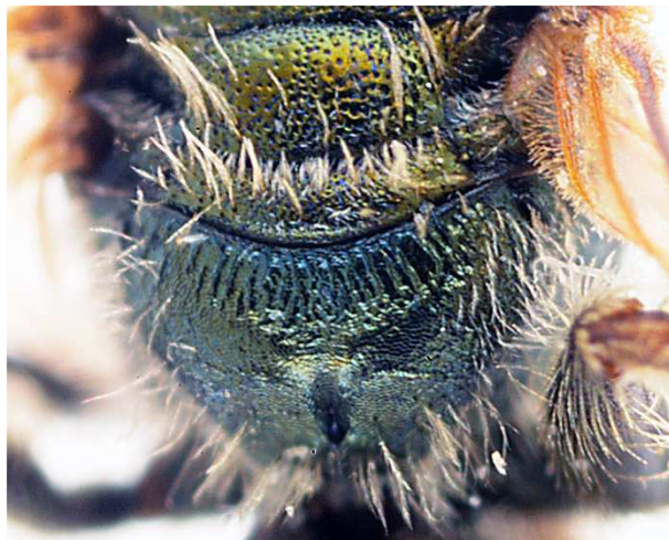
c - propodeum