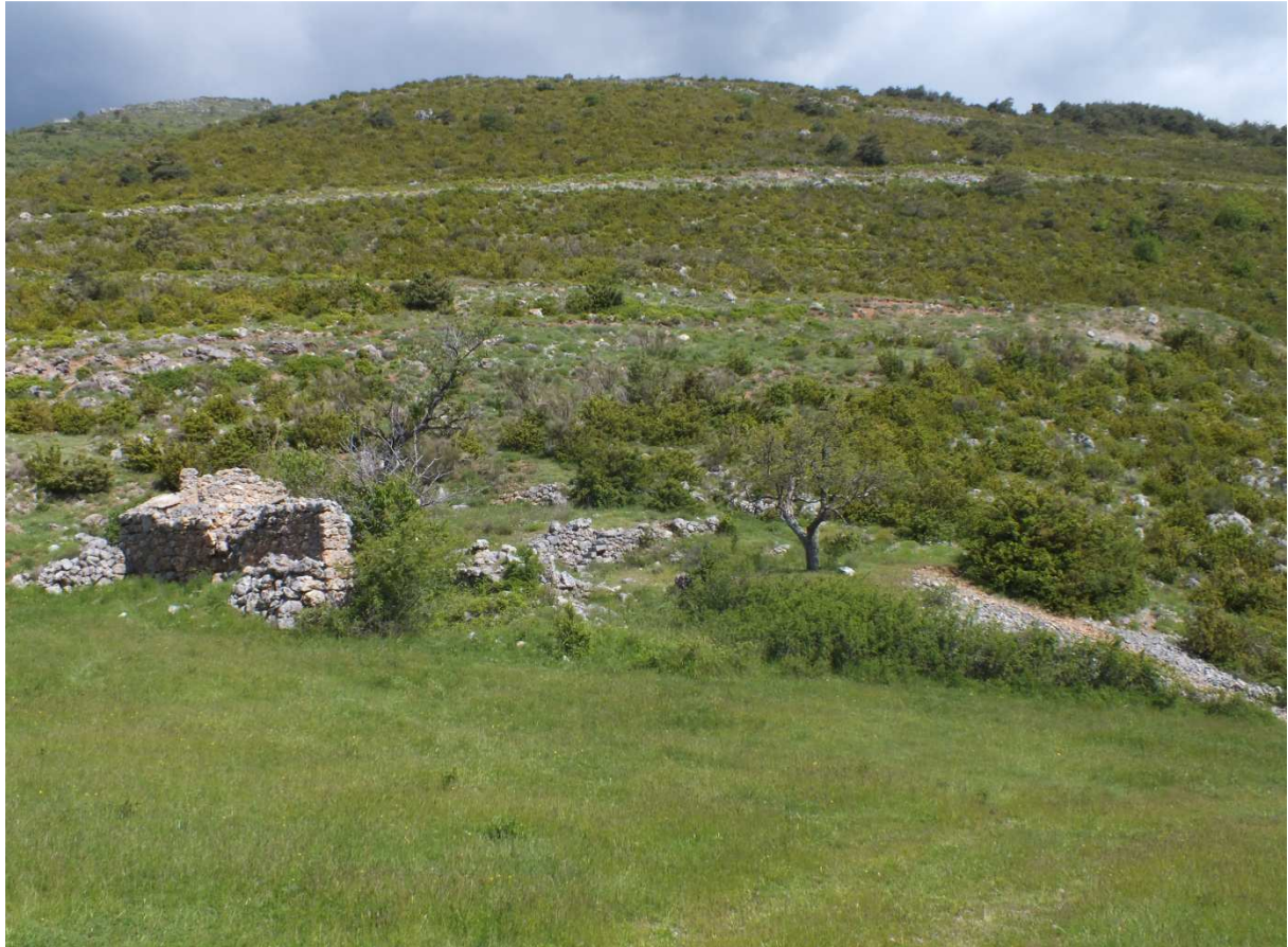
Fig. 4. Fontan, Campei, juin 2013, habitat de Lasioglossum duckei duckei.