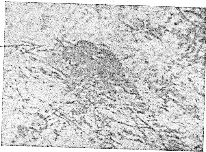
Fig. 1. Confusus de zonderlinge boschduinhommel, eene der 20 die er zaten.

't Was 'n werk, voor Meester Van Dingenen en zijn makker, om dien wonderdoenden Confusus-kerel tot op 1 meter afstand te naderen en te trekken! Van 's avonds te voren een kuil graven, nabij den top van dien 10 meter hoogen bloot liggenden boschduin, waar wij nu, op 't psychologisch oogenblik, tot aan de schouders in „ge-