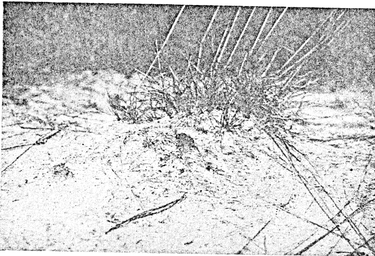
Fig. 3. Een der 20, t.w. dezelfde Confusus-hommel op afstand.

En die stijfstekende antennen, zoolang hij op wacht zit ofwel zijn „tour de propriétaire” doet! zoo scherp periscoop-achtig in de lucht stekend en tegen de lucht scherp afstekend; die antennen met hun honderden microscopische reukpapillen en hun honderden andere prikkel registreerende sensillen . . . Die Confusus hier te Lubbeek, en, over 10 jaar, die 20 te Meetshoven, elk op zijn bloemtopje of op zijn mostroppeltje