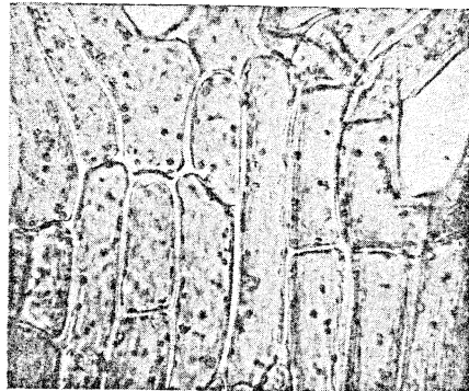
Fig. 1. Trichocolea tomentella . Celnet van het blad. In de cel zijn bladgroenkorrels zichtbaar, de streping is ontstaan door de cuticula-verdikkingen.

Het is natuurlijk niet mogelijk, de absolute ouderdom van zulk een kleilaag aan te geven, maar als we zeggen: honderden eeuwen, dan is die taxatie zeker niet aan de hoge kant. Relatief is de ouderdomsbepaling ook al niet gemakkelijk, omdat de fos-