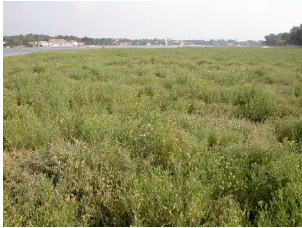
Figure 3. Aperçu du site du lac d'Hossegor (F-40), dominé par Aster tripolium (Asteraceae)

Le 12 septembre, Stuart Roberts (Université de Reading, Angleterre) m'informe de la confirmation par George Else (Museum National d'Histoire Naturelle de Londres, Angleterre) de la présence de Colletes halophilus à Lanton sur le Bassin d'Arcachon (F-33) sur la base d'individus transmis par François Dittlo. Le 29 septembre, l'identité des individus prélevés au Lac d'Hossegor (F-40) a été confirmée par Stuart Roberts et Nicolas Verecken.