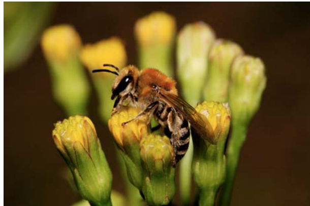
Figure 1. Femelle de Colletes halophilus (Hym. Colletidae) sur une inflorescence d' Aster tripolium (Asteraceae)