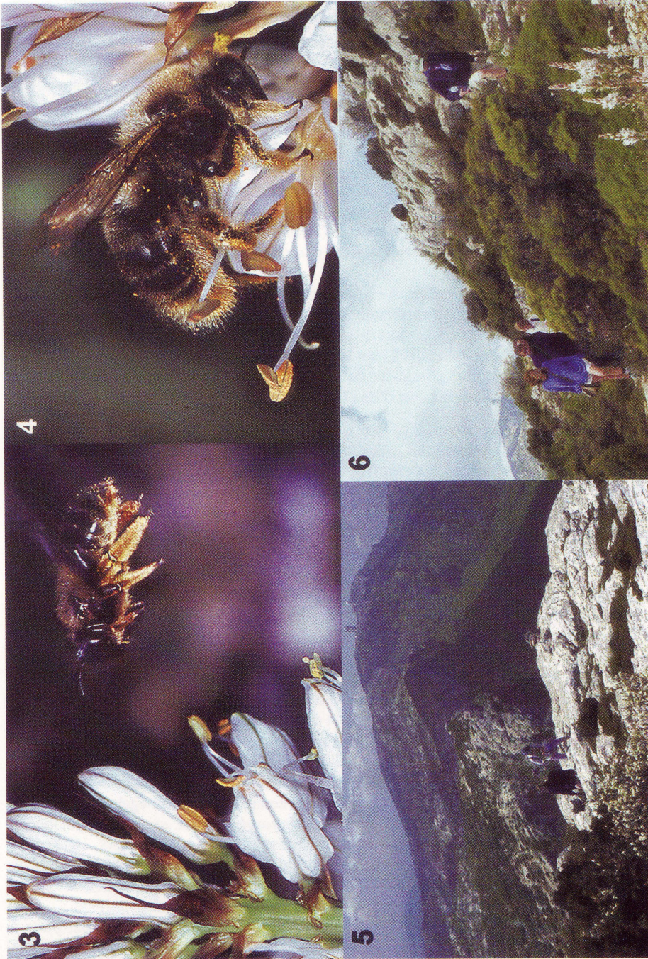
Fig. 3 à 6. - 3, Xylocopa cantabrita femelle en vol face à Asphodelus ramosus L. ; - 4, X. cantabrita mâle sur Asphodelus ramosus L. ; - 5 et 6, Crête de la chaîne de la Sainte-Baume et détail du biotope de X. cantabrita .